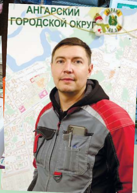
Операторы пульта централизованного наблюдения

Дорогие наши! Помните, что для постоянной надежной защиты необходимо вовремя менять элементы питания в переносимых тревожных кнопках и радиодатчиках, т.к. от их работоспособности зависит безопасность объекта и вас! Прошу также не забывать менять аккумуляторные батареи в охранных, пожарных приборах и вовремя сообщать в технический отдел о видимых неисправностях оборудования.